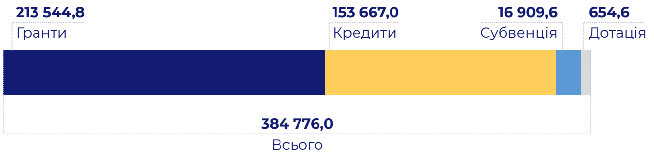
Таблиця 1. Повідомлення про фінансування проєктів із відбудови