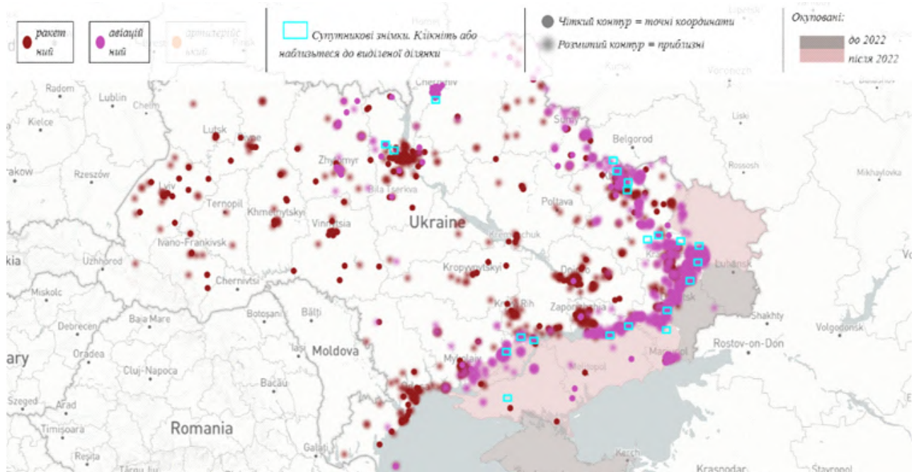
Рис. 2. Карта ракетних та авіаційних обстрілів регіонів України (станом на 02.02.23) 6 .

ції 4 . Крім цього, майже в кожній області низка населених пунктів зазнає ракетних обстрілів, які призводять до руйнування інфраструктури й загибелі людей. Станом на лютий 2023 року велика кількість влучань (не враховуючи території, на яких ведуться або велись бойові дії) російських ракет та дронів зафіксована також на Дніпровщині, Львівщині, Одещині 5 .